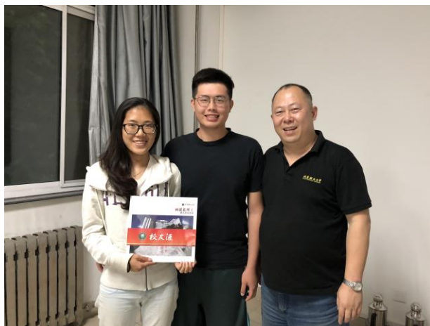
[圖 4] 與數碼攝影技術與藝術的老師合影